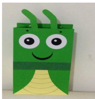
Cigarra caixa de leite