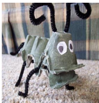
Cigarra caixa de ovo