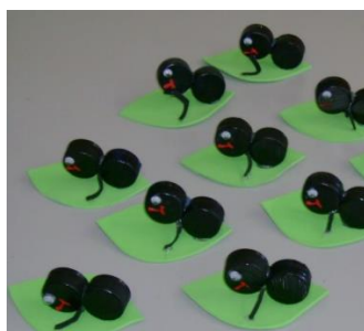
Formiga tampinha de garrafa